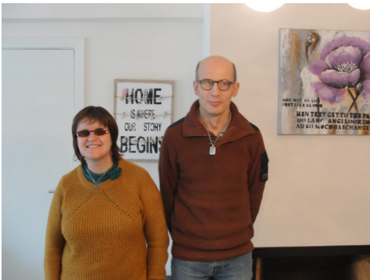
Léticia en Jan

Personen met een handicap hebben recht op een eigen woonplek. Dat inclusief wonen in de praktijk realiseren, is niet evident. Mensenrechtenorganisatie GRIP verzamelde getuigenissen die inspireren.